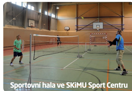
Sportovní hala ve SKiMU Sport Centru