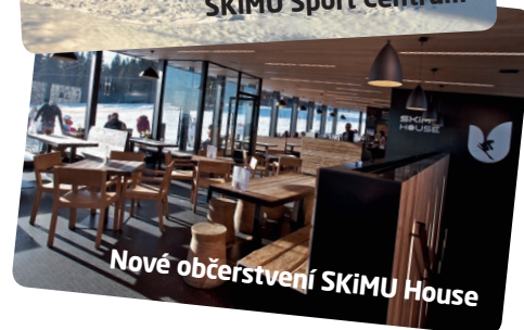
Nové občerstvení SKiMU House