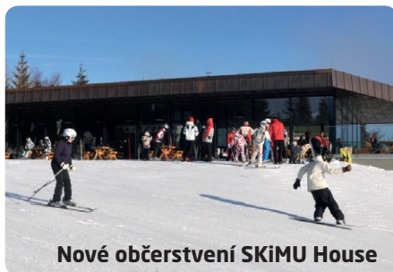
Nové občerstvení SKiMU House