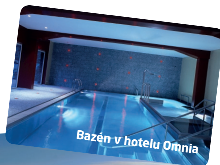
Bazén v hotelu Omnia