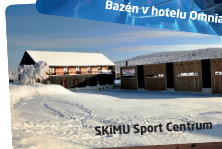
SKiMU Sport Centrum